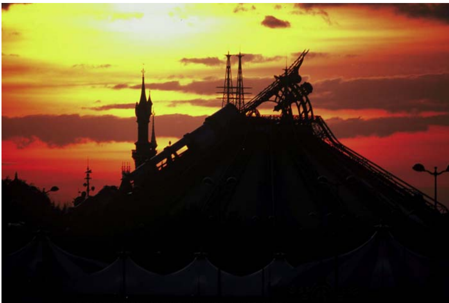
SPACE MOUNTAIN MISSION 2 - DISNEYLAND PARK - DISNEYLAND RESORT PARIS

Am nächsten Morgen klingelt der Wecker erneut bereits um 6:00 Uhr und wieder sind wir unter den ersten Gästen beim Frühstück und auch im Disneyland Park. In meinem Bauch schwirrt ein Schwarm Hornissen herum, denn gleich um 10:00 Uhr wenn die Studios aufmachen, wollen Gerlinde und ich dort rüber gehen. Hier steht für mich die ultimative Herausforderung auf dem Programm. Der Tower of Terror wartet! Alleine der Anblick des Towers aus der Ferne, macht mich schon ganz kribbelig. Aber ich habe es Gerlinde versprochen, außerdem habe ich bisher ja jede Attraktion in Disneyland