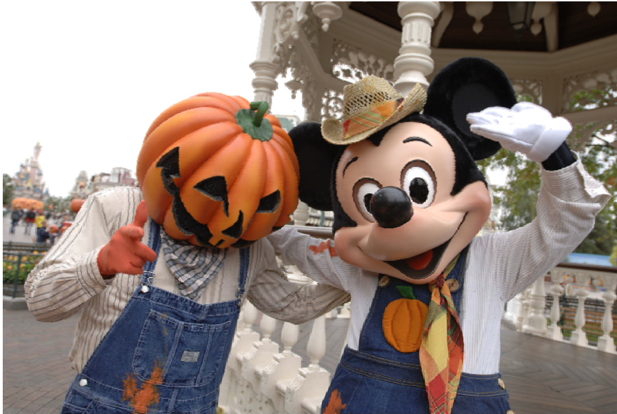
HALLOWEEN SÄSON AT DISNEYLAND RICHKEIT PARK